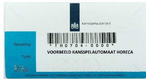
Voorbeeld van een Ksa-merkteken