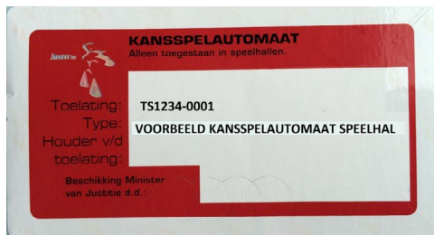
Voorbeeld van een ouder merkteken (Minister van Justitie)

De merktekens zijn in de loop van de tijd enigszins van uiterlijk en opschrift veranderd. Op de huidige merktekens wordt de Kansspelautoriteit vermeld, op oudere merktekens staat de Minister van Justitie of de Minister van Economische Zaken. 5 Deze uiterlijke verschillen zijn niet belangrijk: het gaat erom dat een merkteken ooit is afgegeven. Een modeltoelating voor speelautomaten wordt voor onbepaalde tijd afgegeven, het merkteken verjaart in principe niet. Oude merktekens op bestaande modellen blijven daarom gewoon geldig. Ter illustratie zijn hieronder voorbeelden van een oud en een huidig merkteken afgebeeld, en een merkteken bestemd voor behendigheidsautomaten. De eerste afbeelding betreft een merkteken bestemd voor een speelhalautomaat (rood merkteken, TS-nummer). De tweede afbeelding betreft een merkteken voor een kansspelautomaat bestemd voor de horeca (blauw merkteken, TH-nummer). De derde afbeelding betreft een merkteken bestemd voor behendigheidsautomaten (groen merkteken, TB-nummer).