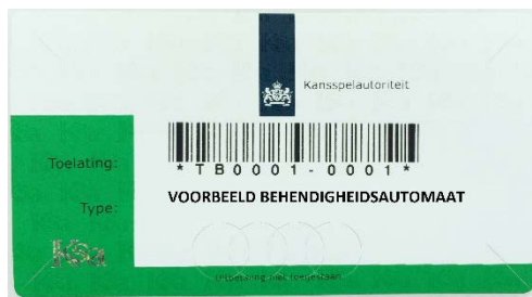
Voorbeeld van een merkteken voor een behendigheidsautomaat

Kansspelautomaten in speelautomatenhallen kunnen meerdere spelersplaatsen hebben. Een zogeheten meerspeler heeft één merkteken, dat meestal is aangebracht op de hoofdunit. Meerspelers zijn speelautomaten waar meerdere spelers tegelijkertijd aan hetzelfde spel kunnen deelnemen (zie paragraaf 3.4.3).