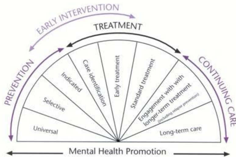
Figuur 1 Het spectrum van interventies voor psychische gezondheidsproblemen en psychische stoornissen