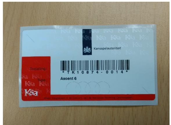
Voorbeeld van een modern Ksa-merkteken

Het merkteken geeft aan op welke locaties een speelautomaat mag staan. Er zijn vier verschillende soorten (speelcasino's, speelautomatenhallen, hoogdrempelige horeca en behendigheid) met elk hun eigen opstellocaties.