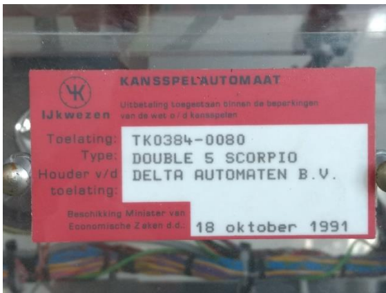
Voorbeeld van een ouderwets merkteken

De merktekens zijn in de loop van de tijd enigszins van uiterlijk en opschrift veranderd. Op moderne merktekens wordt de Kansspelautoriteit genoemd, op oudere staat de Minister van Justitie of zelfs de Minister van Economische Zaken 10 . Uiterlijke verschillen zijn niet belangrijk: het gaat om de soort. Ter illustratie hieronder voorbeelden van een oud en modern merkteken. Beide betreffen casino-automaten (rood merkteken, TK-nummer)